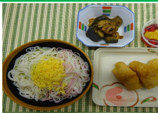
7月7日 七夕の日 涼味あふれるそうめ のゼリー。好評でした！