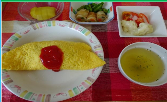
6月24日 お誕生日食のオムライス 心を入れて、1つ1つ巻いています