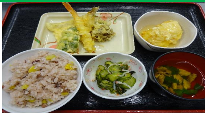
敬老メニューで「天ぷら御膳」をご用意しました。